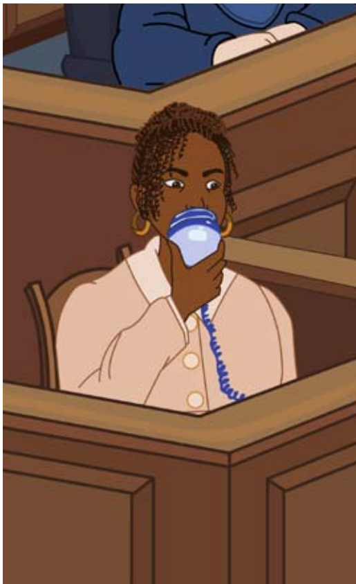
Reportero de la Corte