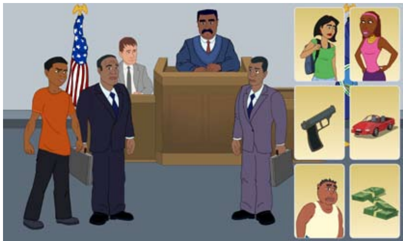
Carga de la Prueba