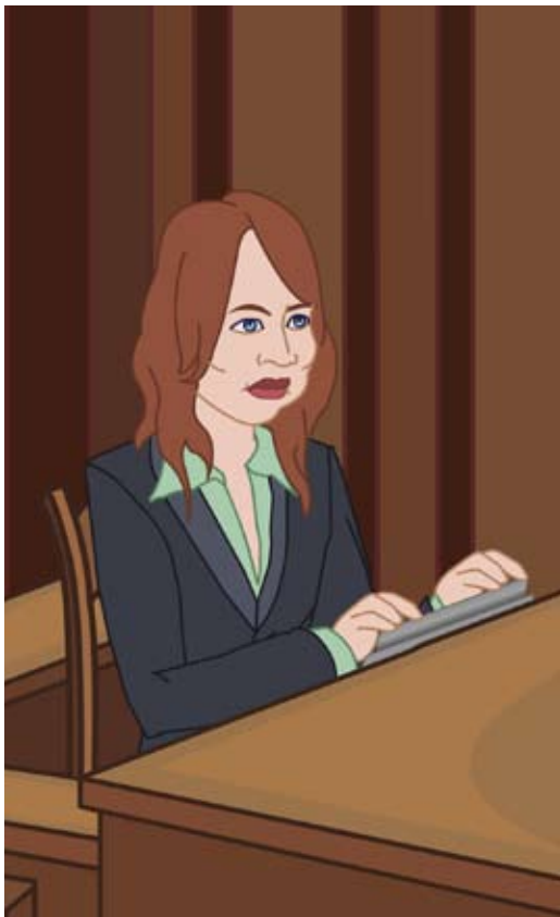
Secretario de la Corte