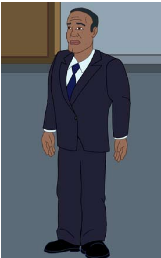
Abogado Defensor / Abogado de la Defensa