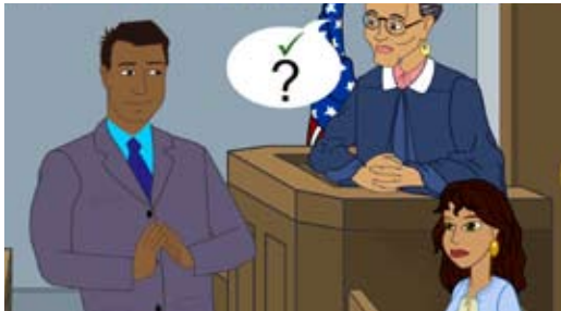
Objeción (Sostenida / Anulada)