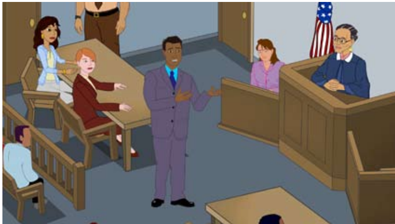
Juicio Sin Jurado