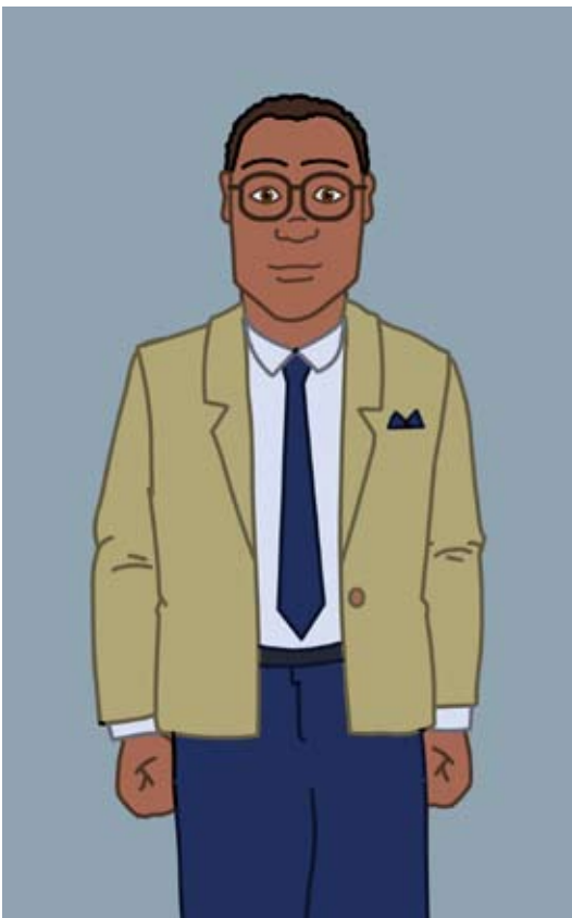
Perito o Consultor Técnico / Testigo Experto