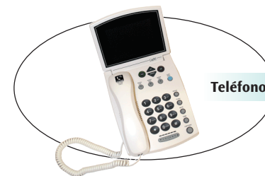
Teléfono con subtítulos (CapTel)