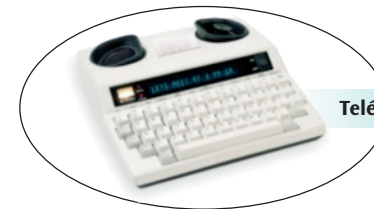
Teléfono de texto (TTY)