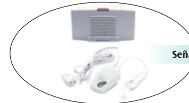
Señaladores de timbre

Para ver más opciones de equipos, consulte el Formulario 14-264 del DSHS, Solicitud de equipo de telecomunicación.