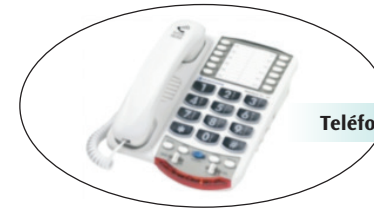
Teléfono con amplificación