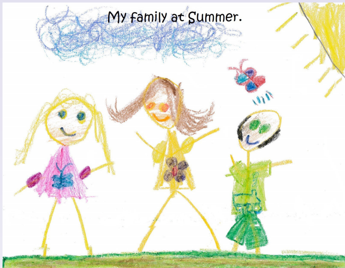
មើលលោក អាយុ 6 ឆ្នាំ សម្លេងនៃការប្រកួតប្រជែងរបស់កុមារ ឆ្នាំ 2016។

ទូរស័ព្ទ ៖ 1-888-201-1014 - ប្រសិនបើអ្នកមានអាយុក្រោម 60 ឆ្នាំ និងមានប្រាក់ចំណូលទាប។ រិទ្ធិសន្តិសុខ ខេត្តវ៉ាស៊ីនតោន 206-464-1519។ ប្រសិនបើអ្នកមានអាយុលើស 60 ឆ្នាំ ដែលមានប្រាក់ចំណូលនៅកម្រិតណា មួយ សូមហៅទូរស័ព្ទទៅកាន់លេខ 1-888-387-7111។