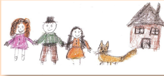
អាមេរិក អាយុ 5 ឆ្នាំ សម្លេងនៃការប្រកួតប្រជែងរបស់កុមារ ឆ្នាំ 2004