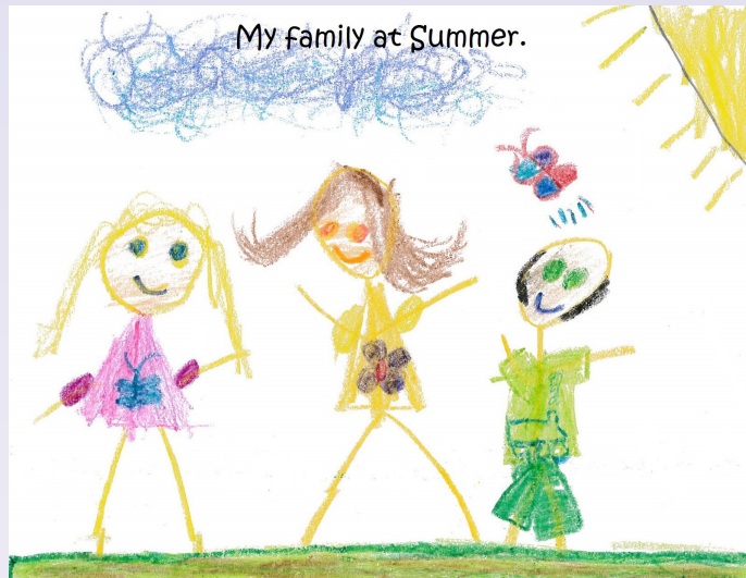
Melena Da'deedu tahay 6. Tartanka Codadka Carruurta 2016.

Bogga internetka: www.washingtonlawhelp.org